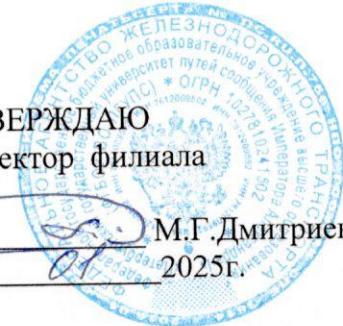
График промежуточной аттестации

по основной образовательной программе среднего профессионального образования по ППССЗ